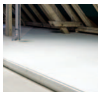
Fertig: glatt, stabil und belastbar

Durch Nut- und Feder-Verbindung schnelle Verlegung und frei von Wärmebrücken