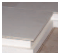
Achtung: Kreuzfugen vermeiden!