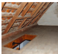
Teurer Energieverlust bei ungedämmten Dachböden