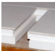
Elemente aneinander schieben