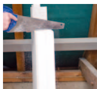
Einfaches Schneiden mit dem Fuchsschwanz