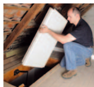
Die Dachboden-Elemente passen durch jede Dachluke