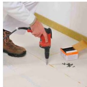
Befestigen durch Verschrauben...