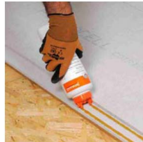
Auftragen des FERMACELL Estrich-Klebers im Falzbereich

Unsere Empfehlungen basieren auf umfangreichen Prüfungen und Praxiserfahrungen. Sie ersetzen nicht Richtlinien, Normen, Zulassungen sowie mitgeltende technische Merkblätter. Wegen der Vielzahl möglicher Einflüsse bei der Verarbeitung und der Anwendung empfehlen wir, stets eine Probeverarbeitung und -anwendung vorzunehmen. Aus den Angaben können keine Ersatzansprüche hergeleitet werden. Lieferung, Abwicklung und Gewährleistung auf die von uns zugesicherten Eigenschaften erfolgt gemäß unserer aktuell gültigen Allgemeinen Verkaufs- und Leistungsbedingungen.