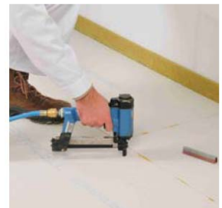
... oder Spezialklammern innerhalb von 10 Minuten